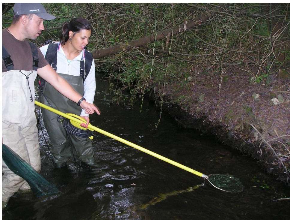
Inventários – Pesca elétrica